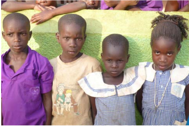
Abb. 5: Vier Patenkinder, die über die Naume-Kinderstiftung durch personengebundene Spenden gefördert werden und somit die Bright Valley Schule besuchen können.