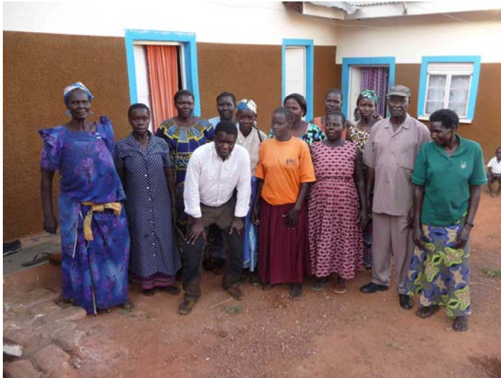
Abb. 7: Treffen mit Erziehungsberichtigten um deren Nöte und Sorgen zu erfahren, aber auch um zu informieren, dass von der Stiftung Eigenleistung im Rahmen ihrer finanziellen Möglichkeiten erwartet wird.

Die diesjährigen Aufgaben der Naume-Kinderstiftung sind u. a. den Schulbau sorgfältig zu planen und mit dem Bau noch dieses Jahr zu beginnen. Zum Plan gehört auch die Vorbereitung der ersten Baumaßnahmen und Suche nach weiteren finanziellen Mitteln für den Schulbau sowie für die Fortsetzung der Stipendien für 16 Stiftungsschüler und die 8 Patenkinder. Derzeit sind wir dabei das gekaufte Grundstück in das Grundbuch bei der Baubehörde in Gulu eintragen zu lassen, die Baugenehmigung zu beantragen und das Baugrundstück zu umzäunen.