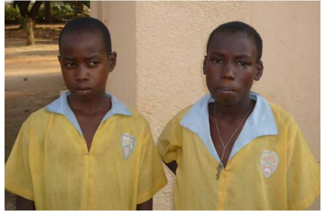
Abb. 6: Zwei weitere Patenkinder, die ebenfalls über die Naume-Kinderstiftung durch personengebundene Spenden unterstützt werden und die Bishop Angelo Negri-Schule besuchen.