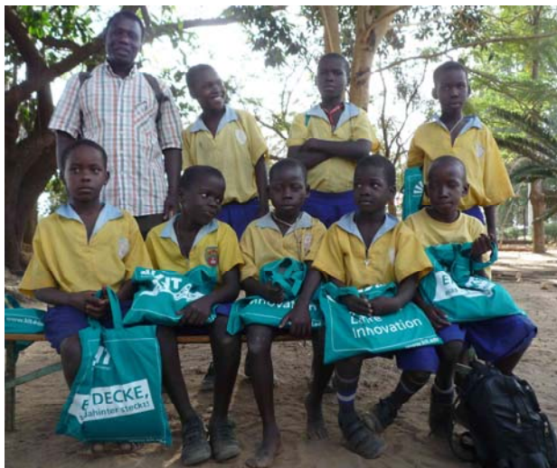
Abb. 3: Acht Jungen, die Stipendien zum Besuch der Bishop Angelo Negri-Internat-Schule von der Naume-Kinderstiftung erhalten.

Die meisten der Stipendiaten entwickeln sich in der Schule sehr gut und kommen gut im Unterricht zurecht. Einer der Jungen ist sogar unter den Schulbesten. Leider gibt es auch einige Kinder, die aufgrund ihrer fehlenden Vorkenntnisse noch Schwierigkeiten mit der englischen Sprache haben und dem Unterricht, der auf Englisch stattfindet, nur mühsam folgen können. Drei der Mädchen sind aufgefallen, weil sie von Mitschülern Gegenstände entwendeten. Eine mögliche Ursache könnte misslungene moralische Erziehung durch die Erziehungsberechtigten sein. Solche Kinder haben durch den Krieg noch nicht gelernt sich an gesellschaftliche Normen und Werte zu halten, sondern ergreifen alle Mittel von denen sie glauben, dass sie sie zum Überleben benötigen. Die Schule arbeitet hart um derartiges Verhalten positiv zu beeinflussen. In einem Treffen mit den Erziehungsberechtigten (Abbildung 7) haben wir uns u. a. auch über solches Verhalten ausgesprochen und sie um ihre Mithilfe gebeten. Auf der anderen Seite haben wir die Nöte und Sorgen der Erziehungsberechtigten gehört, aber auch deutlich gemacht, dass Eigenleistungen dort, wo sie möglich sind, erwartet werden, d.h. die ihnen anvertrauten Kinder in der Erziehung zu unterstützen, auch beim Kauf von Kleidung und Schulmaterial. Erst wenn ihre finanziellen Möglichkeiten überschritten sind, wird die Stiftung die Aufwendungen übernehmen.